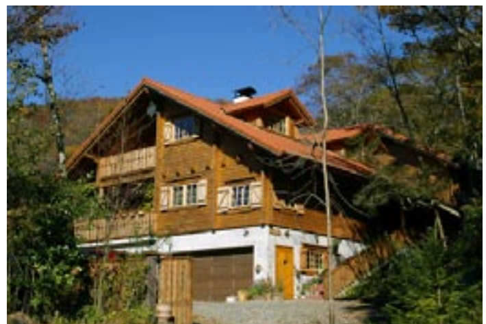
REY AUDIO “Casa de Daiju”