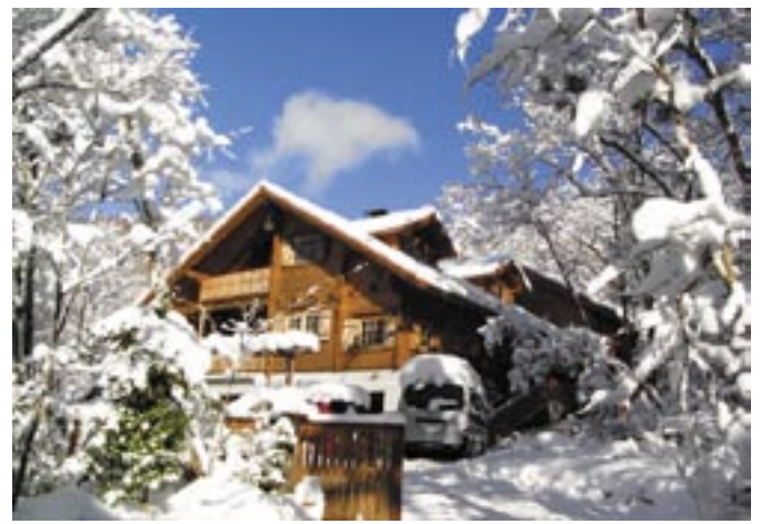
REY AUDIO "Casa de Daiju"